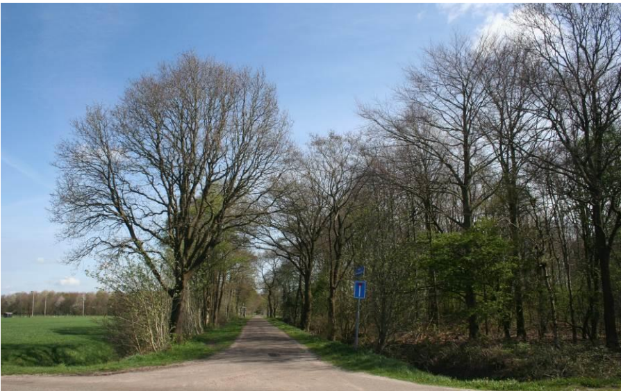
Leidijk bij Trimunt

Tijdens de middeleeuwse transgressieperiode van 1200 tot 1500 n. Chr., toen er veel wateroverlast ontstond, waren de inwoners van het Westerkwartier wel gedwongen daartegen iets te ondernemen. Kort na het jaar 1250 werden in deze streek de eerste dijken opgeworpen. Ook langs de hooggelegen gasten werden dijkjes opgeworpen, leidijken genoemd, die het water dat via afvoersloten en open riviertjes binnendrong, moesten buitensluiten.