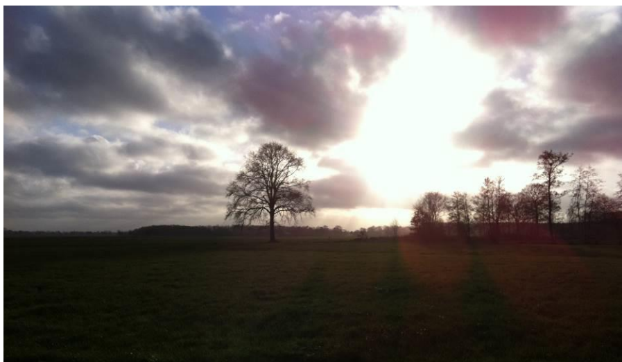
Trimunt op een winter namiddag