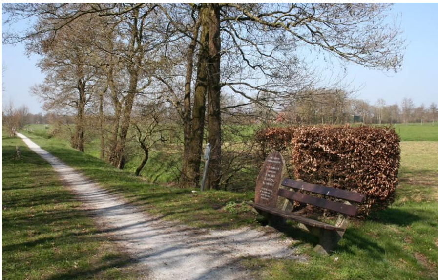
Oude trambaan met monument