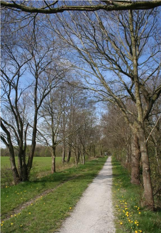
Oude trambaan Drachten-Groningen

De Philipsfabriek in Drachten toonde interesse in de tramlijn als transportroute voor de levering van goederen (de Philipsfabriek werd in 1951 in het kader van de werkgelegenheid in Drachten opgericht). Er werd ten noorden van Drachten een verbindingsspoor aangelegd dat aansloot op de tramlijn. Philips was op het laatst de enige klant van NS op deze verbinding. Het goederenvervoer vond plaats tot 1985. Daarna is de lijn buiten gebruik gesteld en vervolgens in 1988 volledig opgebroken. De spoorrails zijn verwijderd en het gedeelte tussen Marum-West en Trimunt is nu een wandel- en fietspad.