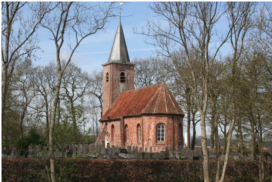
De Romaanse Kerk te Marum